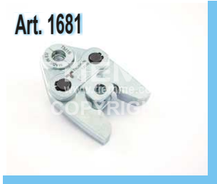
Pinze "TM" per pressature "TM" lisovací čelist