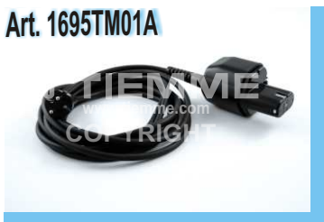
Adattatore di rete 230 Vac Adaptér 230Vac