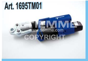
Pressatrice a batteria Lisovací nástroj na baterie