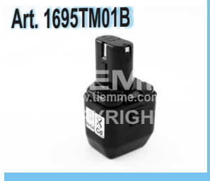
Batteria per pressatrice Baterie pro lisovací nástroj