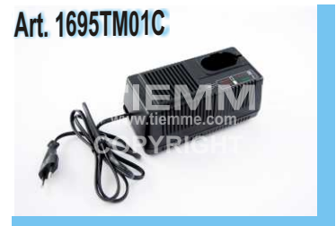
Caricabatteria per art. 1695TM01B Nabíječka baterií pro artikl č. 1695TM01B