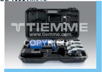
Pressatrice a batteria Lisovací nástroj na baterie